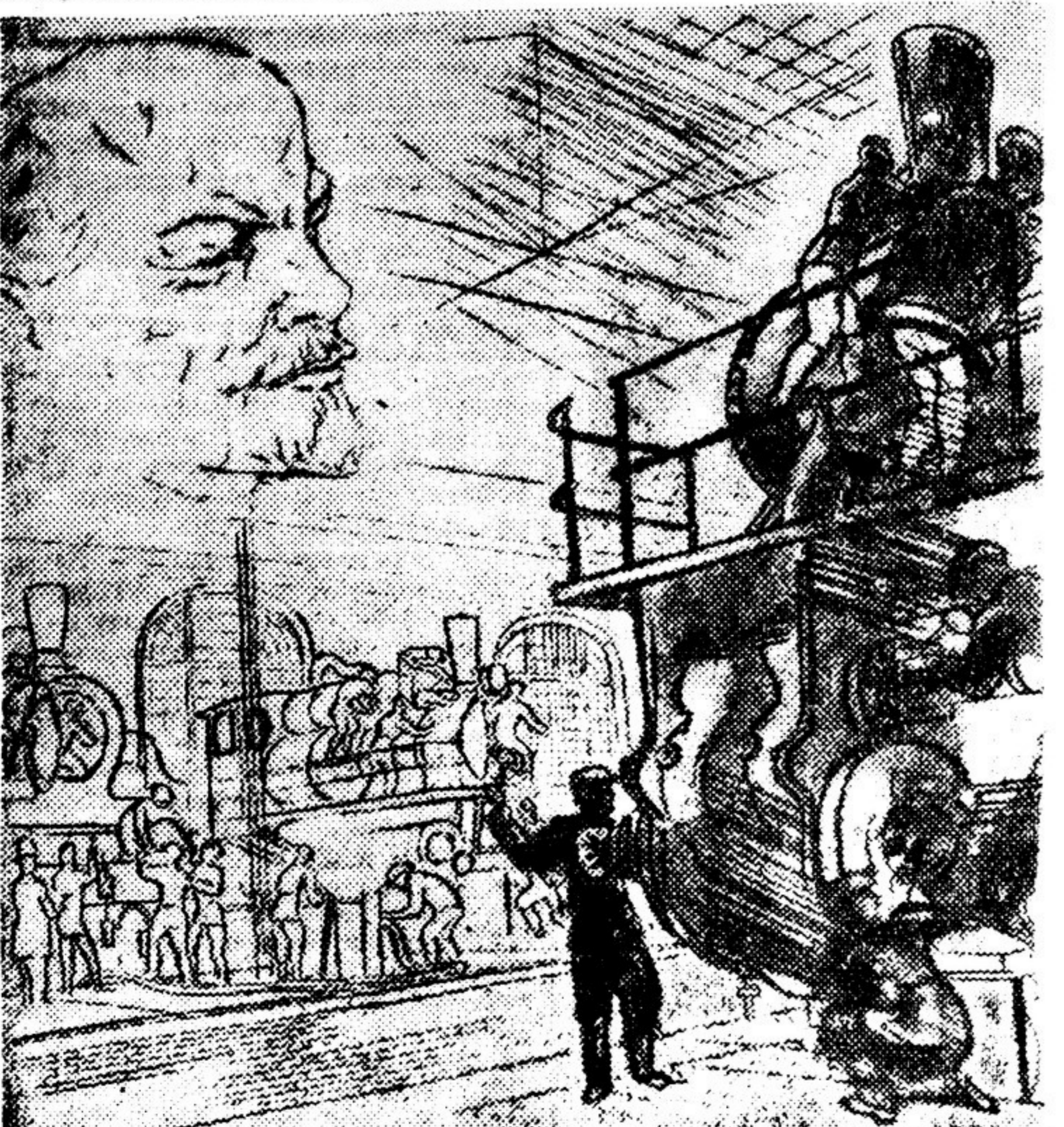
ЛЕНИН В ГРАВЮРЕ. Музей изобразительных искусств открыл выставку, посвященную Ленину в гравюре. Выставка включает гравюры на дереве, офорты, гравюры резцом и литографии, посвященные образу и жизни Ленина.

вариациями, которые ваялись за просмотром, мы заметили ряд вопросов. И вот что поразило меня: оказалось, никто из крестьян ничего не знал об аэрахе, но все прекрасно знали о столыпинской реформе, о ее сути. Это, независимо от того, были ли это одиночки или колхозники, волновали они и те же места брошюры, все противопоставляли старое новому, более эмоционально высказывались крестьяне, однако все отвечали на те вопросы, которые ставились. Брошюра эта пять лет тому назад имела несомненно агитационное значение, и потому, подправив некоторые места, я пустила ее в обращение. Теперь ее надо было написать иначе, учитывая, что коллективизация стала господствующей формой сельского хозяйства, что сейчас уже другие вопросы волнуют колхозников, чем те, которые волновали пять лет назад, что народ стал уже совсем другой — политически сознательный. Теперь надо пожить в колхозах, взять другие районы, включить в брошюру ряд новых вопросов. Для чего я обо всем этом пишу? Мне кажется, что литераторы, знающие современную колхозную деревню, могли бы особо ярко выявить, чем сейчас, на данном этапе, близок Ильич колхозным массам, почему он продолжает оставаться для них живым вождем. Настоящую биографию Ильича, по моему, можно написать только коллективными усилиями, и в этой коллективной работе литераторы должны сыграть крупную роль.