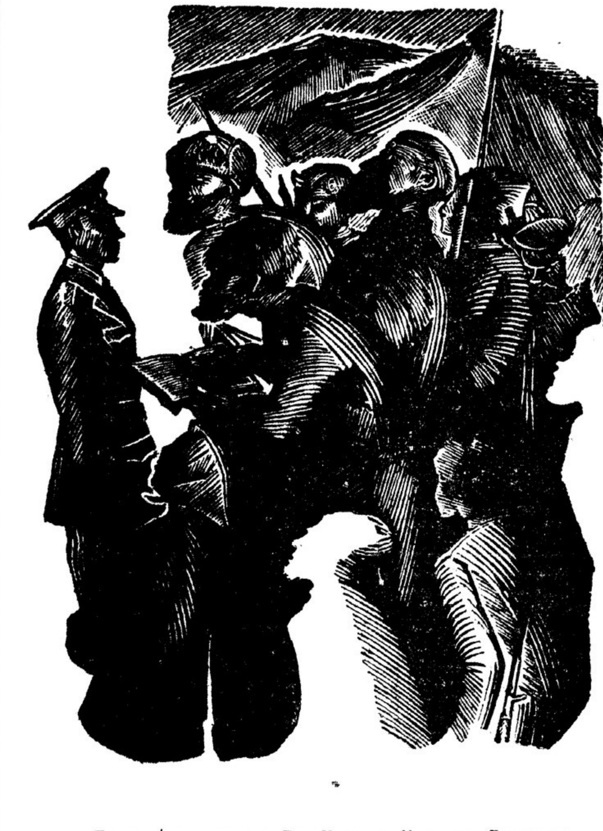
«Повести великих деп» Вс. Иванова. Илл. худ. Гончарова.

Правда, есть случаи глубокого, вдумчивого суждения. Таковой считаем статью тов. Новицкого о судьбах творческой индивидуальности Вахтанговского театра. Я этим отнюдь не выражаю своего согласия или несогласия с названной статьей.