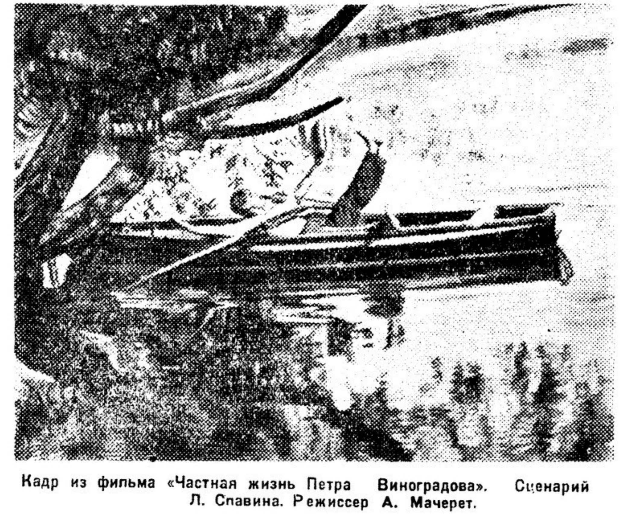
Кадр из фильма «Частная жизнь Петра Виноградова». Сценарий Л. Славина. Режиссер А. Мачерет.